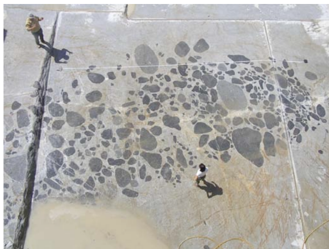
Figura 1 – Foto do enxame de Pomarinho. O Norte está para baixo e a fita métrica marca 5 metros.

O acompanhamento do desenvolvimento da exploração da pedreira, assim como o privilegiado grau de exposição, permitiu definir a morfologia do enxame a três dimensões ao longo de 20 metros de profundidade: ela corresponde, grosso modo , a uma estrutura afunilada, inclinada para oeste e com secção elíptica cuja área tem vindo a diminuir em profundidade. No actual nível de exploração da pedreira (sector NW), a elipse tem eixos de 8m e 3m, estando o maior orientado E-W, perpendicularmente à anisotropia do granitóide hospedeiro. De acordo com a classificação de Tobish et al. (1997), o enxame tem uma geometria do tipo lente.