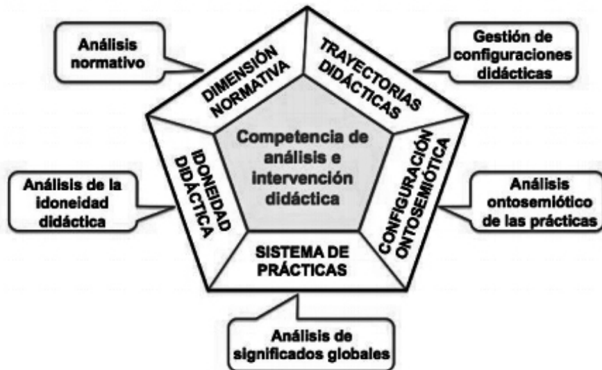
Figura 1. Competencia de análisis e intervención didáctica (Godino, Giacomone et al., 2017, p. 103)

El futuro profesor debe tener los conocimientos necesarios para reconocer, por un lado los diversos significados (entendidos como sistemas de prácticas) del contenido correspondiente y su interconexión, y por otro la diversidad de objetos y procesos implicados (configuración ontosemiótica) para los diversos significados.