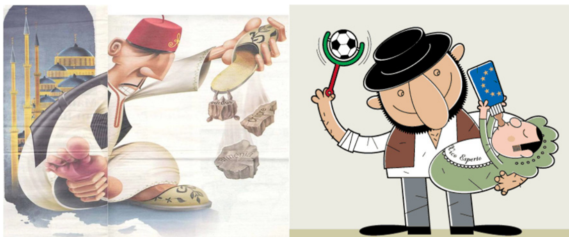
Ilustração 1/PT 12 e 1/TR 13 : Caricatura do País e Povo da Contraparte

A primeira imagem refere-se a uma caricatura do país/povo da contraparte (ver Ilustrações 1/PT e 1/TR), pretendendo-se, com a sua apresentação, levar os participantes a explorarem a questão das representações do país, povo e cultura da contraparte, ou seja, abrir um espaço de diálogo e discussão que inclua, para além da expressão das suas atitudes face à própria ilustração (nomeadamente no que toca aos elementos de natureza claramente estereotípica apresentados), a manifestação não só do modo como eles próprios veem a contraparte, mas também do modo como percecionam que a mesma é representada no âmbito dos seus próprios países em geral. Neste contexto, pretende-se, ainda, aceder às autoimagens indiretas dos intervenientes, perguntando-lhes como, na sua perspetiva, a contraparte poderia caricaturar o seu próprio povo.