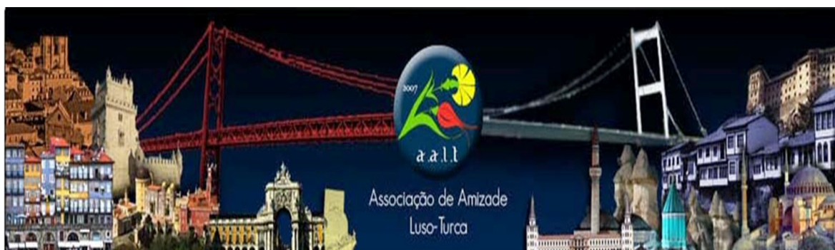
Ilustração 3: Ponte Luso-Turca 15

A terceira e última imagem apresentada (ver Ilustração 3) refere-se às relações entre Portugal e a Turquia, assim como aos modos como será possível incrementar e desenvolver a relação intercultural entre ambos os países e os seus respetivos povos, pretendendo-se suscitar um diálogo acerca de diferentes tópicos ligados à relação intercultural luso-turca, entre os quais se poderão destacar o modo como, até à data, e em termos gerais, se constituíam as relações entre Portugal e a Turquia, os meios e estratégias a desenvolver no sentido de incrementar e desenvolver essas mesmas relações, e, por último, o papel da ELCE, em particular no que se refere aos cursos da língua da contraparte desenvolvidos pelos estudantes, na aproximação intercultural entre os dois países e as suas respetivas culturas e povos. Ainda no contexto deste último tópico, decidiu-se introduzir como tema final das sessões a possibilidade de se criar uma plataforma online de comunicação entre estudantes que estão a aprender a língua da contraparte nos seus próprios países, pedindo, aos participantes, sugestões relativamente ao modo como gostariam que a mesma funcionasse e às temáticas que deveria incluir.