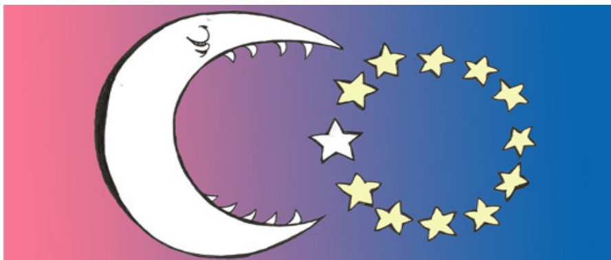
Ilustração 2: A Turquia na Europa 14

A segunda imagem apresentada (ver Ilustração 2), que não deixa de se envolver de uma certa polémica, refere-se, fundamentalmente, à temática da adesão da Turquia à União Europeia, pretendendo-se com a sua apresentação, para além de identificar as reações imediatas dos participantes à mesma, incitar a um debate relativo à questão da adesão da Turquia à UE que possibilite aceder às suas imagens e atitudes face a esta temática e, simultaneamente, aferir, através dos enfoques realizados no contexto das dinâmicas de grupo criadas, quais as dimensões (e.g., geopolítica, económica, cultural, religiosa) que se apresentam como fulcrais na constituição e expressão dessas mesmas imagens e atitudes.