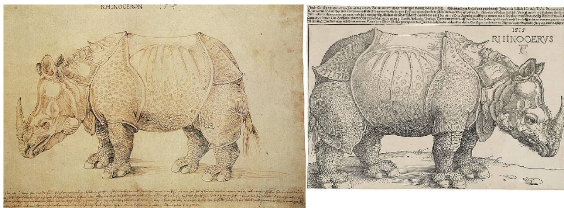
Fig.1 Desenho preparatório Rhinoceron 1515, de Dürer, actualmente no British Museum e a correspondente xilogravura, 1515 Rhinocerus .

Por que razão se tornou a representação de Dürer hegemónica? Em primeiro lugar, pelo uso da xilogravura, que lhe assegurou maior difusão. Esta opção não só tornava o produto final mais barato como permitia um maior número de cópias [21]. Uma gravura sobre chapa permitia linhas mais finas e sombreado, mas uma placa-matriz de madeira permitia imprimir na mesma página do texto, além de que as matrizes de madeira eram mais duráveis do que as chapas de cobre. A isto acresce, naturalmente, o facto de o artista de Nuremberga ser um dos maiores mestres do seu tempo. Foi a excelência técnica da 1515 Rhinocerus que permitiu que a mesma circulasse como uma mercadoria de sucesso [4] e se impusesse relativamente a representações rivais como a de Hans Burgkmair, de falaremos mais frente.