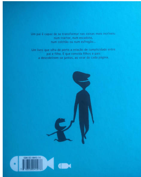
FIGURA 5 – Contracapa do livro Pê de pai