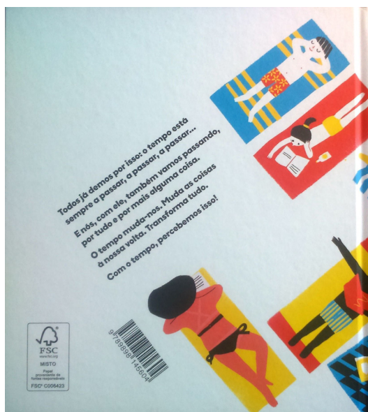
FIGURA 2 – Contracapa do livro Com o tempo

O primeiro caso integra volumes como O primeiro gomo da tangerina , Ir e vir e Com o tempo (Figura 2). Nos três exemplos a orientação do código de barras, seja vertical ou diagonal, procura acompanhar as linhas dominantes da imagem, repetindo, no primeiro caso, o paralelismo das linhas, ou, nos outros, uma disposição semelhante a outros elementos. Refira-se que estes casos não mereceriam atenção particular se não tivesse previamente sido identificada uma estratégia sistemática de tratamento deste elemento. Veja-se, assim, como o recurso prévio à ilustração de códigos de barras tem implicações na leitura destes elementos em livros posteriores, condicionando a atenção que lhes é dedicada e a sua interpretação. Trata-se de um exemplo evidente de desenvolvimento e aprofundamento de competências de leitura, na medida em que o olhar do leitor é (ou passa a ser) educado para dar atenção a elementos novos.