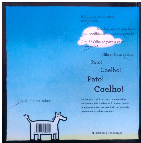
FIGURA 6 – Contracapa do livro Pato! Coelho!

poéticas criativas pessoais. É o caso de Tom Lichtenheld, ilustrador norte-americano, autor de várias obras (Figura 6), onde os códigos de barras são alvo de algum tipo intervenção.