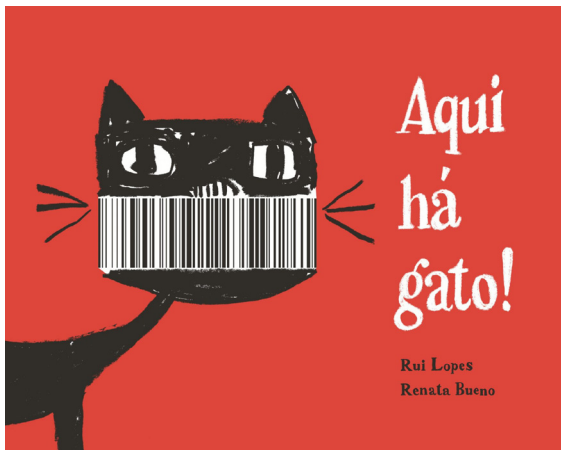
FIGURA 1 – Capa de Aqui há gato!

Os códigos de barras podem integrar as ilustrações de um livro, aproveitando a sua forma, o traçado paralelo das várias linhas, explorando possibilidades significativas variáveis, como aconteceu recentemente com a publicação Aqui há gato! (Figura 1), de Rui Lopes e Renata Bueno, que recorre a estes elementos em todas as imagens, desafiando a sua capacidade de encontrar novas utilidades, numa espécie de aproveitamento e recombinação da forma, convertida em padrão.