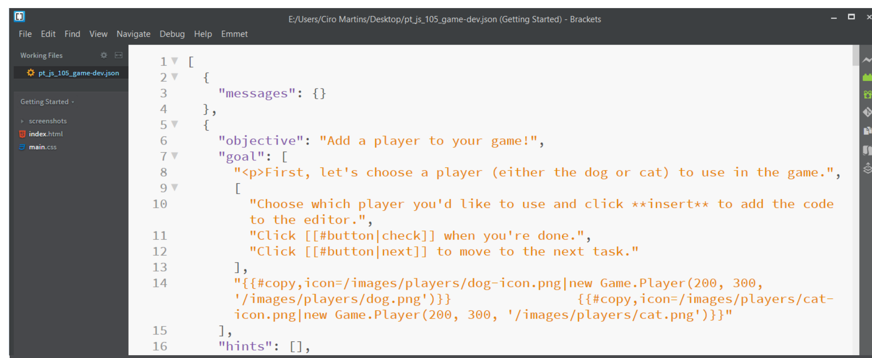
Fig.2 Exemplo real de ficheiro em formato JSON com segmento de texto a traduzir

No âmbito deste projeto, a Tradução e a Terminologia são entendidas como áreas complementares, mantendo, contudo, as respetivas diferenças teóricas e metodológicas. As tarefas a desempenhar pelos alunos inserem-se no âmbito da Tradução Assistida por Computador (Computer-Assisted Translation), mais propriamente da Machine-Aided Human Translation (MAHT), na qual o