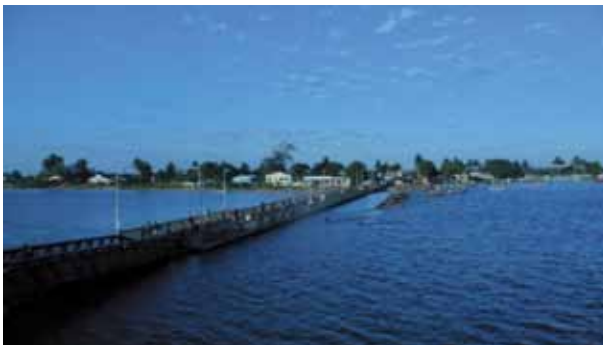
Figura 2. Porto de pesca da comunidade da Catembe.

Os moradores goeses da Catembe dedicam-se maioritariamente à pesca semi-artesanal do camarão. As cerca de 45 famílias goesas que compartilham o quotidiano com as outras populações moçambicanas, estabelecem com elas relações comerciais, ou mesmo de recurso à mão de obra para a manutenção dos barcos de pesca de que são proprietários.