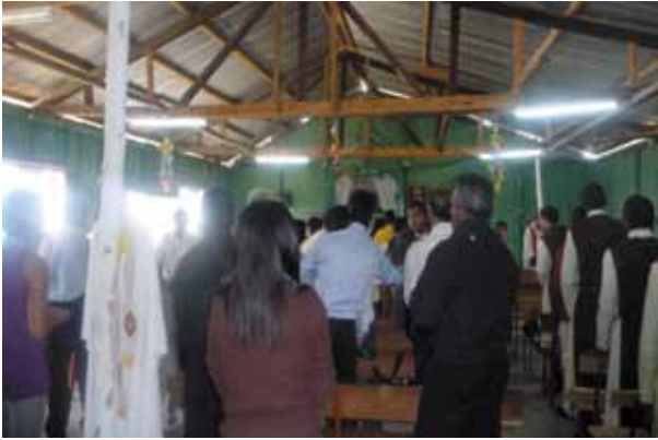
Figura 5. Momento da eucaristia durante a Festa de São Pedro, em Junho.