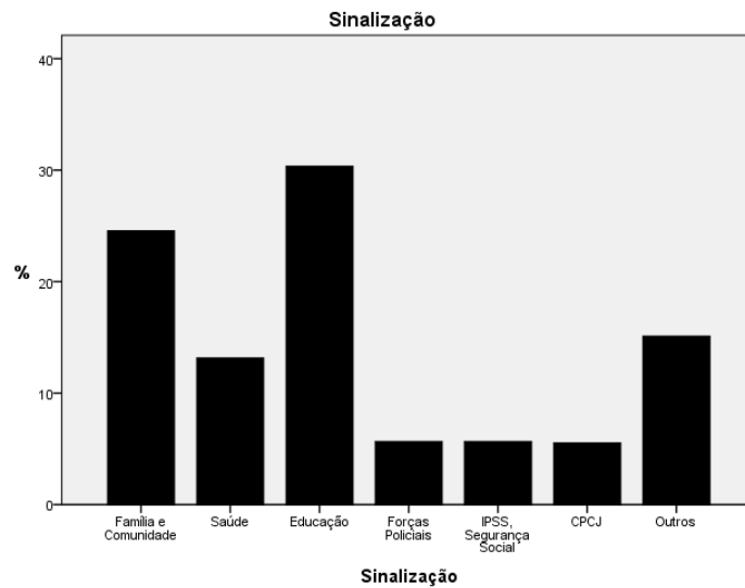
Figura 2 – Gráfico de percentagens dos tipos de sinalização dos casos

Pela análise visual do gráfico da Figura 1, nota-se uma tendência geral para um aumento do número de casos, com “quebras” nos anos 2010 e 2011, comparativamente ao ano 2009.