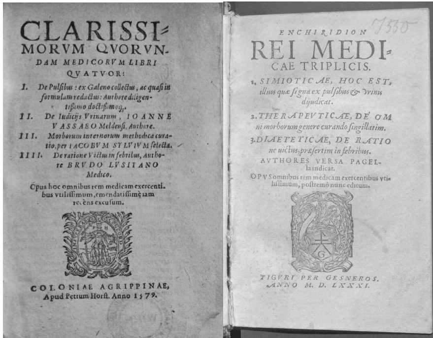
Fig. 3 Frontispício da 2. a edição de Conrad Gesner (Zurique, 1581) Zentralbibliothek Zürich (cota Md J 550)